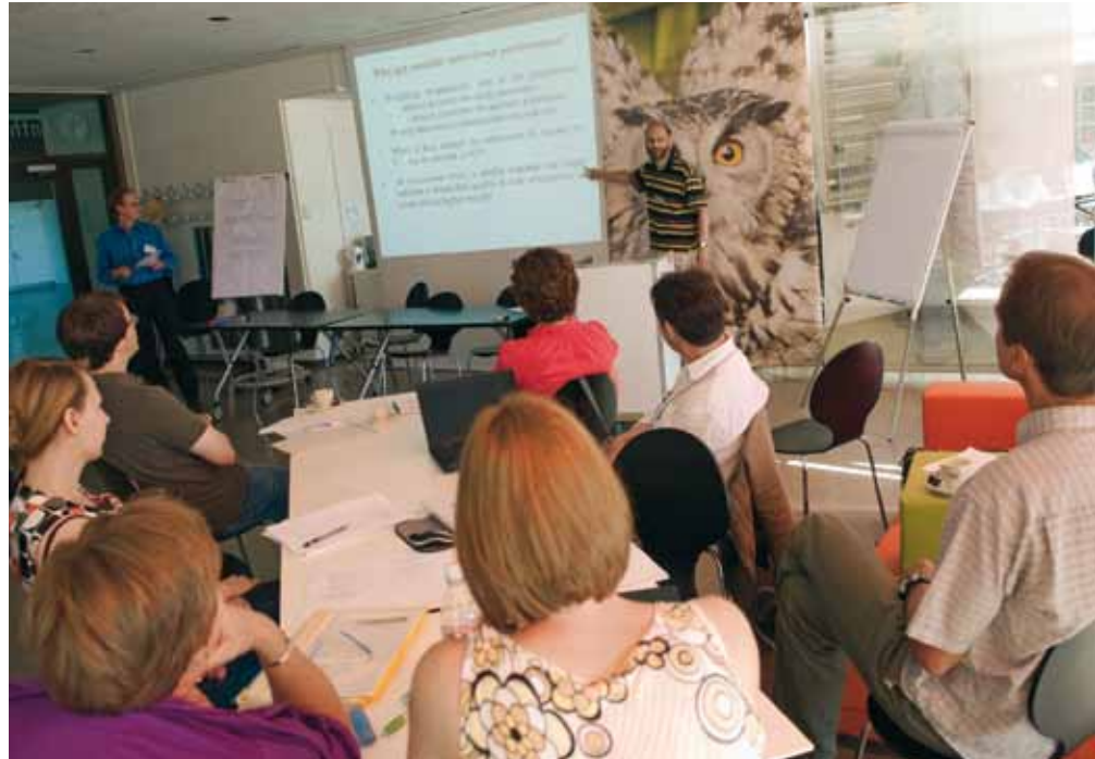
Le master débutera à l'automne 2011 sous la forme d'un programme interfacultaire commun (joint degree), auquel différentes universités romandes et alémaniques seront rattachées.

Ces changements nécessitent des connaissances théoriques et méthodologiques globales en recherche sociale et en opinion publique. Celles-ci ne sont pas requises uniquement dans le domaine académique. La recherche en opinion publique et la recherche sociale appliquées réclament elles aussi des scientifiques bien formés. Contrairement aux autres pays européens et aux Etats-Unis, il n'y a en Suisse aucune filière d'études qui transmette ces connaissances. L'offre se limite à des